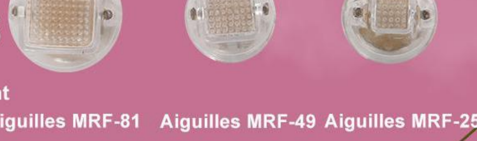
Aiguilles MRF-81 Aiguilles MRF-49 Aiguilles MRF-25

convient à différentes zones de traitement